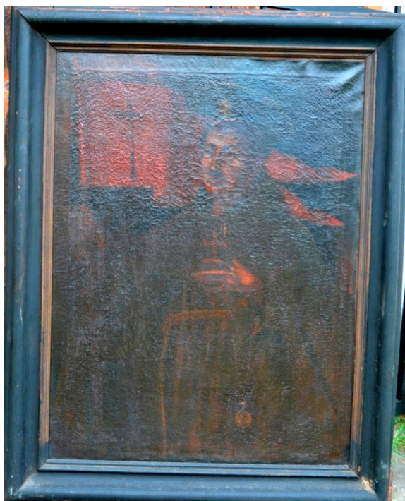
Olejomalba - Sv. Bonaventura H-364